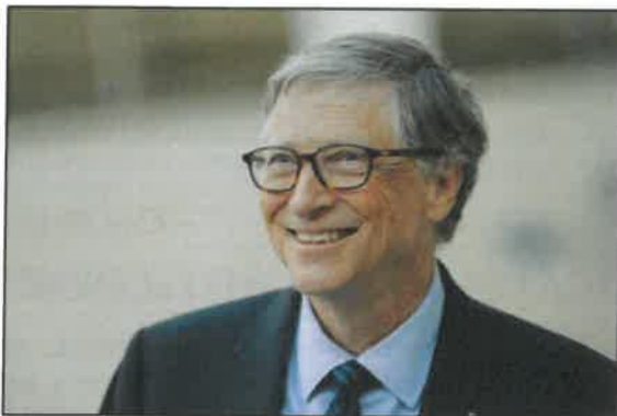
1. ábra: Bill Gates, a Microsoft alapítója

Elméletileg az általános iskolák feladata az élethez alapvető tudás átadása lenne, valahogy ez mégsem érződik mindig... Gondolok én itt arra, hogy hiába tudok rengeteg dolgot Mezopotámia fejlődéséről, vagy Arany János életéről, ha nem tanultam meg bánni a pénzzel, nem tanítottak meg számlát befizetni, stb.... Akármilyen fontos a lexikális tudás, nem garantált, hogy egy mindenképp jeles tanuló sikeresebb lesz az életben, mint egy az iskolán átbukdácsolt, de remek üzleti érzékkel megáldott gyerek. Példának leggyakrabban Bill Gateset, a Microsoft alapítóját hozzák fel, akinek a mai napig nincsen érettségije, mégis a világ 2. leggazdagabb embere a maga kb. 103 milliárd dolláros vagyonával.