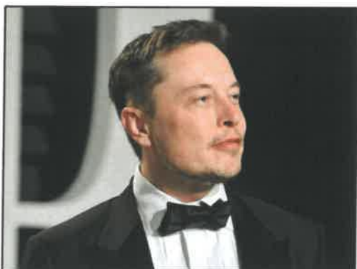
4. ábra: Elon Musk, korunk egyik legsikeresebb embere