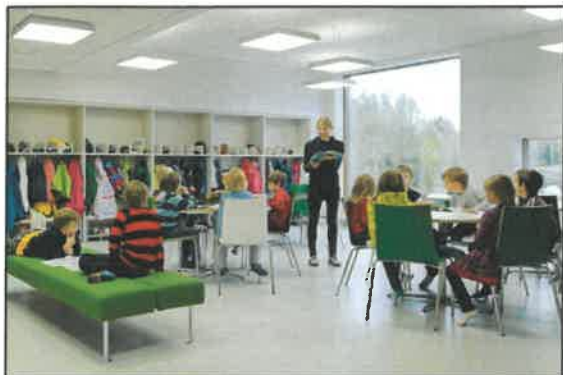
3. ábra: Finn tanóra

Itt lenne érdemes pár szót ejteni a finn oktatásrendszeréről. A tanárok itt a következőket vallják: „Az emberek vagy az életre, vagy az iskolára készülnek. Ők az életet választják.” Ez annyit tesz, hogy a finnknél nincsenek vizsgák; a diákok egyetlen egy központi tesztet töltenek ki 16 évesen, amikor befejezik a középiskolát. Az ide járó tanulók továbbá kevesebb leckével kell, hogy szenvedjenek délutánonként, mivel „a gyerekeknek délután pihenniük, játszaniuk kell, esetleg a családjukkal tölteni az időt”. A finn oktatás még egy fontos része, hogy ingyenes. Teljesen. Ebbe beletartozik az étkezés, a felszerelés és az osztálykirándulások árai is, sőt, ha a diák 2 kilométernél messzebről jár be, iskolabusz áll a rendelkezésükre, amit (meglepő, de szintén) az állam fizet. Az ország évi költségvetésének 12,2%-át költi az oktatásra! Viszont a legjobbnak hangzó dolog számomra, amit a finn oktatási rendszer ígér: a jegyet csak a tanulónak árulják el. Ez egy nagyon apró dolognak hangozhat elsőre, egyeseknél viszont ez is nagy szerepet játszik az iskolától való félelem kialakulásában.